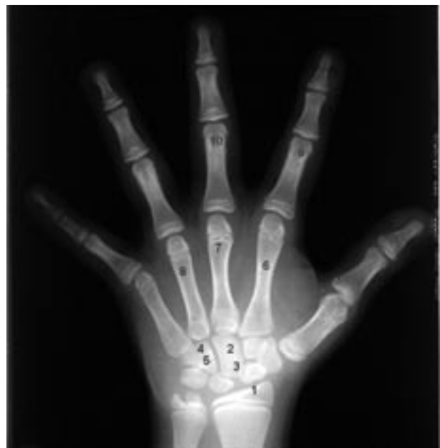
Figura 2 – Radiografia da mão e punho esquerdo, identificando os dez centros de ossificação.